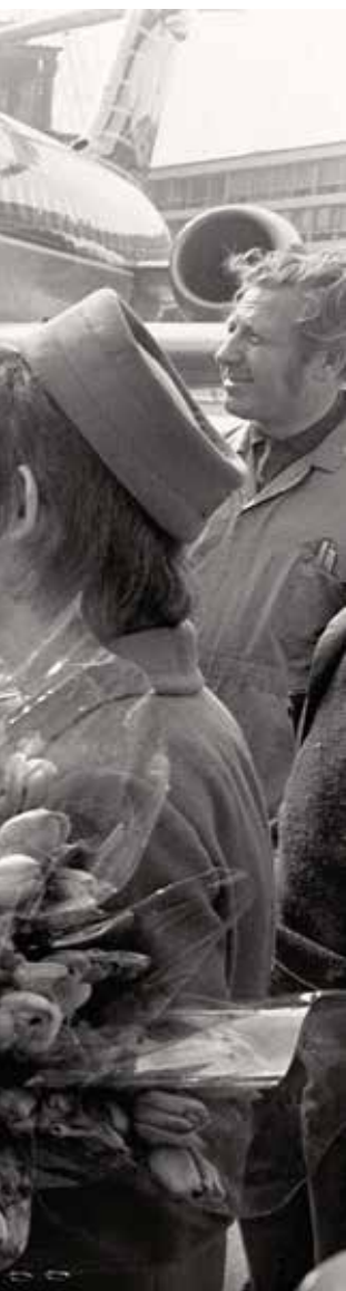
Recepción en el aeropuerto de Amsterdam al Ajax en 1972.

banco de suplentes y encendió un cigarrillo. El partido terminó 1-1 y tres semanas después el Ajax ganó la vuelta por 3 a 0 para coronarse campeón del mundo.