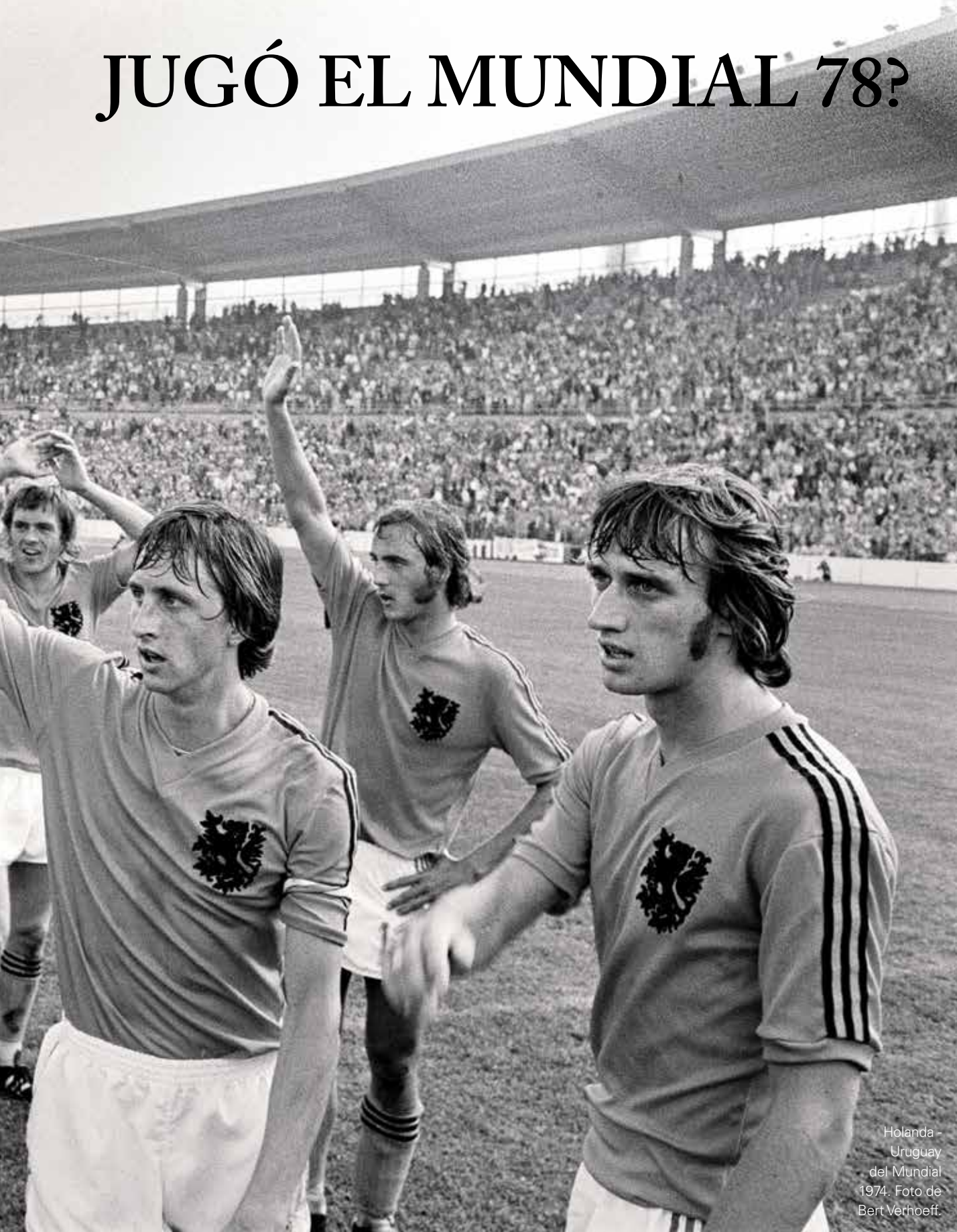
Holanda - Uruguay del Mundial 1978.